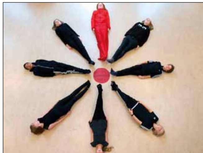
6. klasse lavede denne fine blomst i forbindelse med Knæk Cancer-kampagnen.