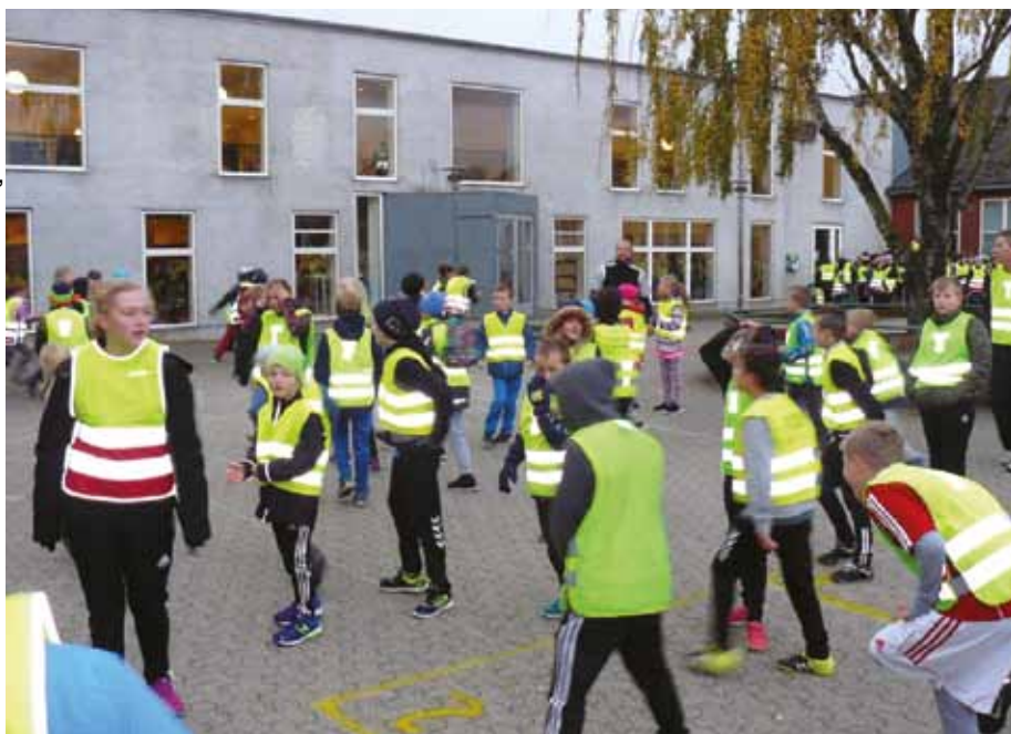
Klipet fra Skolens Forældreintra som information til alle områdets beboere